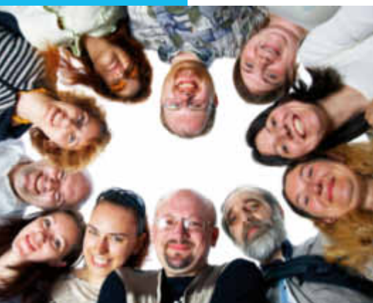
Privates Sprachtraining für jedes Alter

Englisch sprechen, singen und spielen – im Kindesalter lässt sich die wichtigste Sprache der Welt so mühelos erlernen wie die Muttersprache. Deshalb bieten wir in unserer Filiale und den Kindergärten von Abensberg regelmäßig Kurse für den „Nachwuchs“ an. Mitmachen können alle Mädchen und Jungen im Vorschul- und Schulalter. Eines ist sicher: Bei den „First Steps“ in der fremden Sprache garantiert inlingua viel Spaß und Fröhlichkeit.