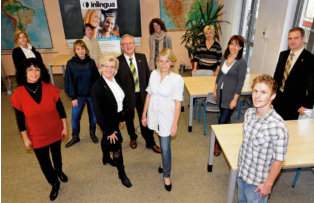
Verwaltung und Lehrerteam von inlingua Ingolstadt und Abensberg