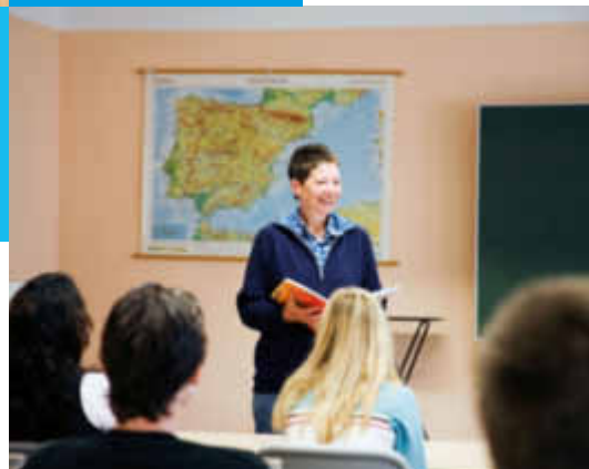
Spanischunterricht in der inlingua Berufsfachschule