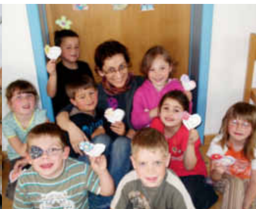
Spielend Englisch lernen – unsere Kinderkurse in Abensberg