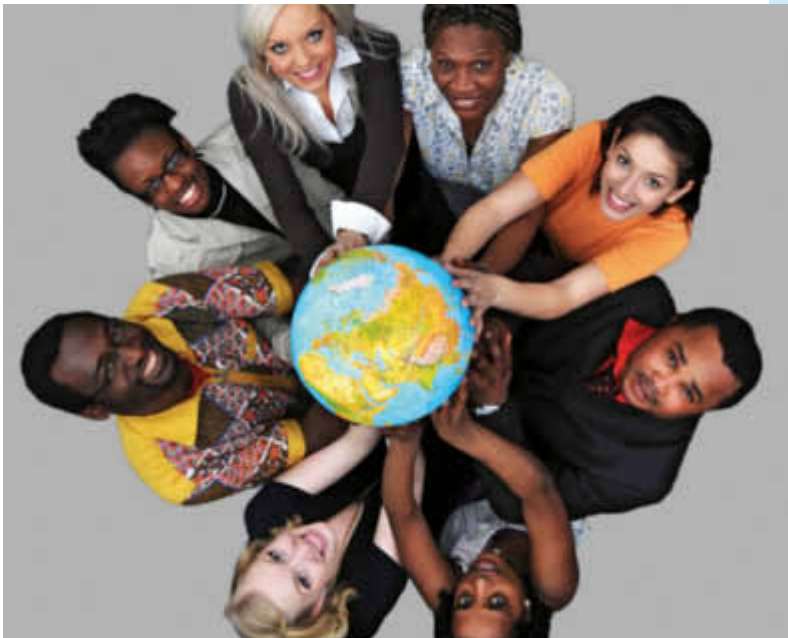
Mit inlingua erfolgreich in Deutschland starten

Bei allen Schritten in die Integration ist inlingua als zugelassener Bildungsträger ein zuverlässiger Begleiter, der Ihnen als Migrant mit Rat und Tat zur Seite steht. Wir stellen für Sie den Zulassungsantrag und bieten Ihnen genau die richtige Schulung für einen optimalen Start in Deutschland.